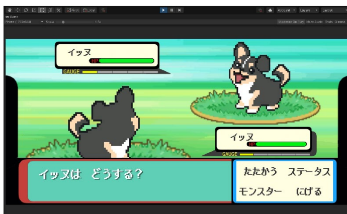
図 1 PC 版ゲーム画面

PC 版では、学習への意欲向上・抵抗感の除去を目的とした、学習用ゲームを開発中。