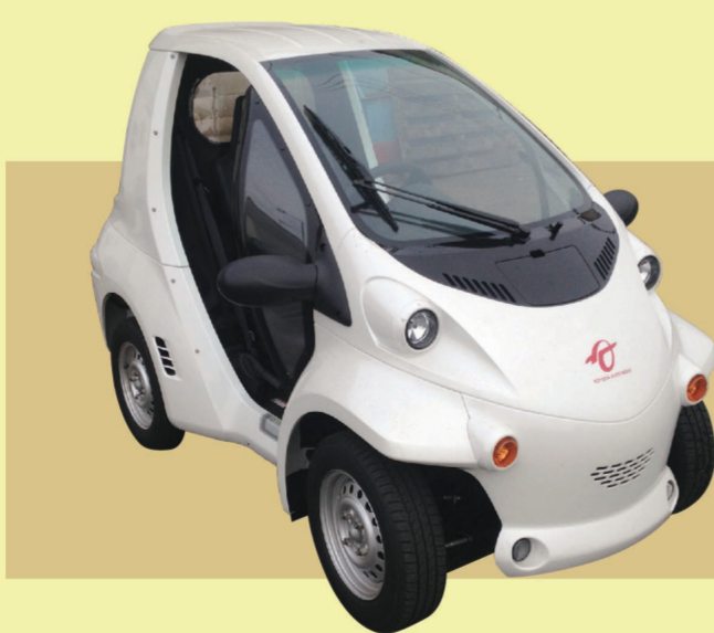
トヨタ車体『コムス』

中小企業と学生による モノづくり交流で 『small and medium enterprises and academia collaboration Manufacturing』 の略