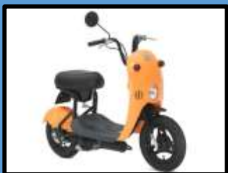
スズキ チョイイン